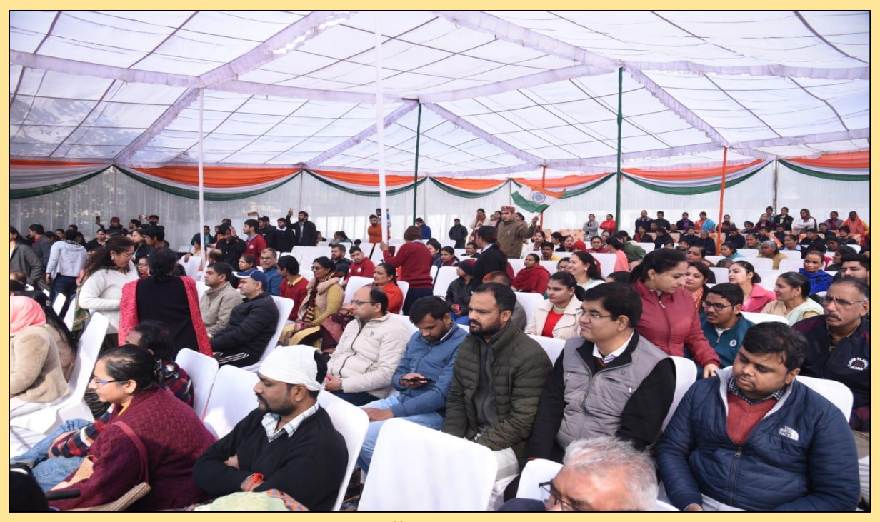
GRIID staff viewing the program