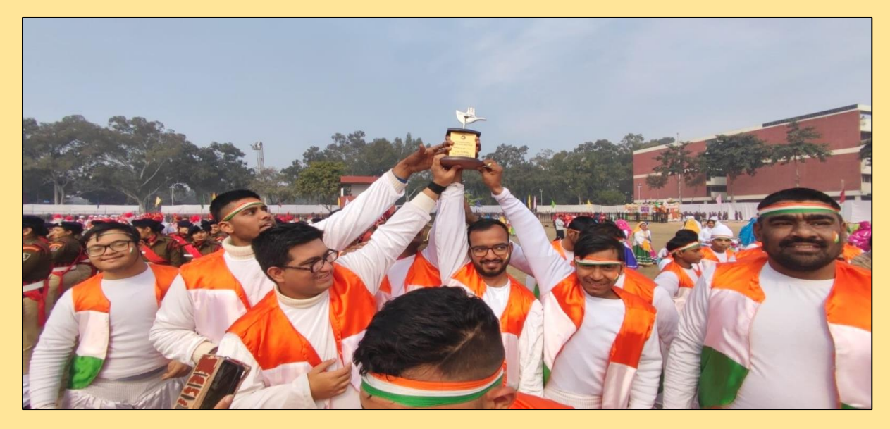
Participants displaying winners' trophy