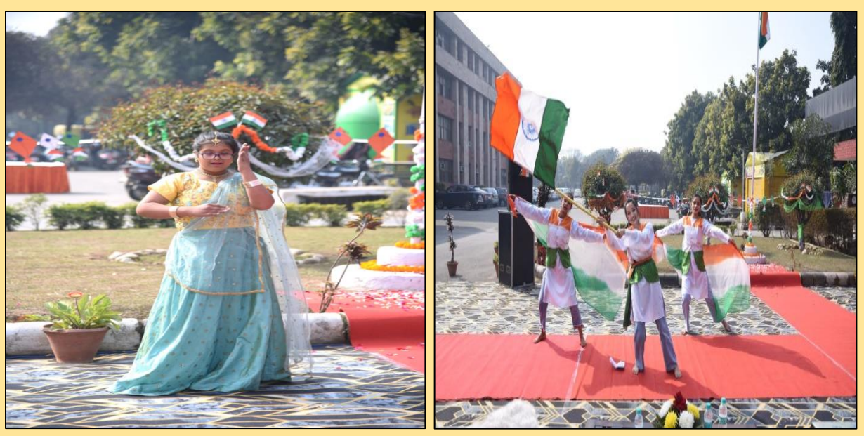
GRIID special student performing dance