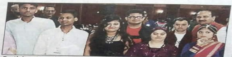
Participants at the audition for 'Walk With A Difference'

Thirty of the best talents were selected for a week-long capacity building programme at Manovikas Kendra Rehabilitation and Research Institute for the Handicapped, under the guidance of mental