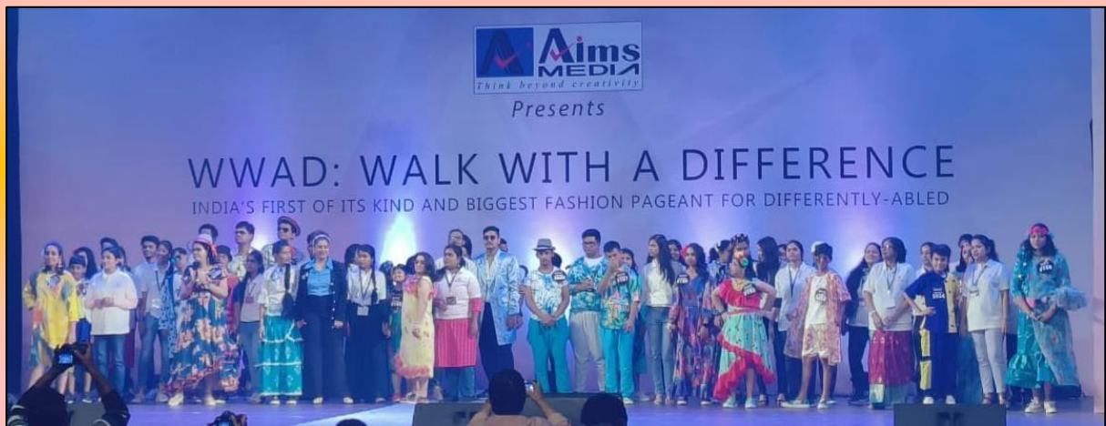
Participants showcased their talents in WWAD