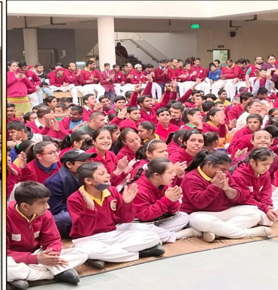
Students enjoy magic show