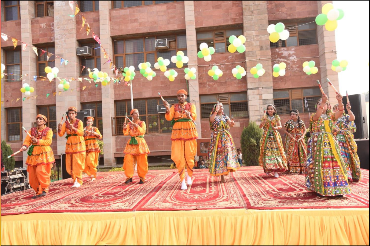
GRIID special school students performing dance