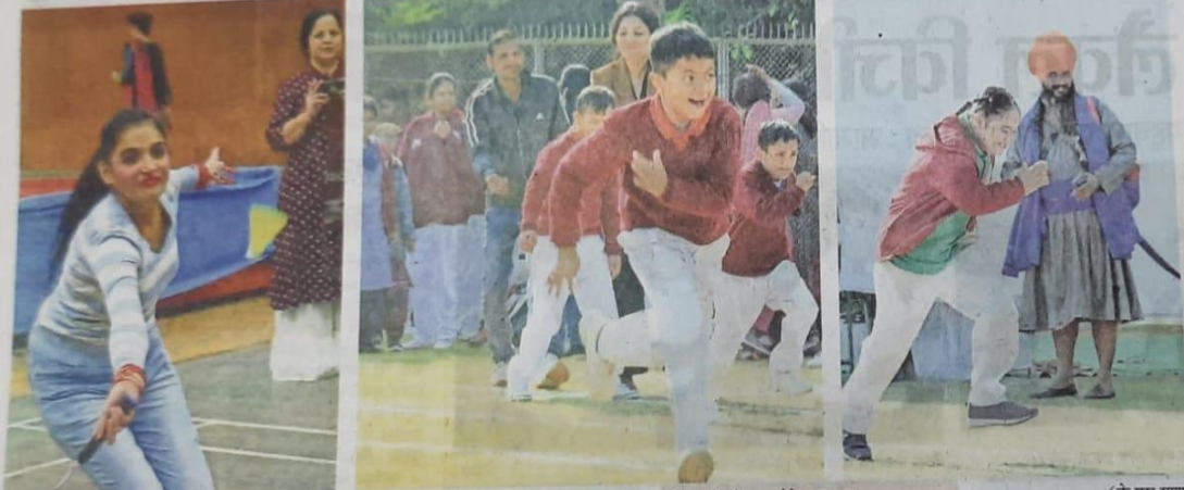
पंजाब विश्वविद्यालय परिसर में ग्रीड के विशेष विद्यालय और कॉलेज के छात्रों के लिए आयोजित दो दिवसीय ग्रीड स्पोर्ट्स मीट में भाग लेते हुए छात्र।