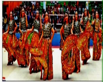
पंजाब यूनिवर्सिटी विश्वविद्यालय हॉल में स्पोर्ट्स मीट के दौरान नृत्य की प्रस्तुति देती छात्राएं। (समाद)

चंडीगढ़। राजकीय ग्रीड स्पोर्ट्स मीट के अंतर्गत विशेष विद्यालय दिवस के रूप में आयोजित किया गया है। इस अवसर पर आयोजित दिवसीय समारोह के तहत किया गया था। उद्घाटन समारोह में विशेष विद्यालय के छात्रों को प्रोत्साहित किया गया।