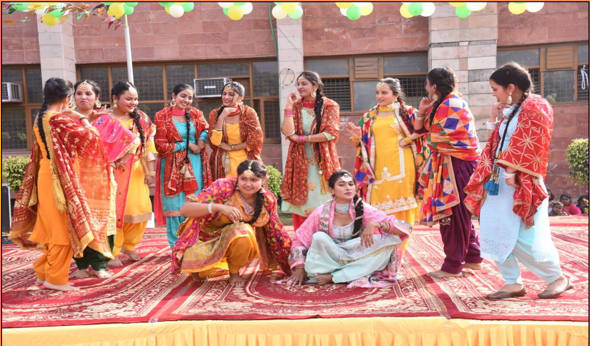
GRIID college students performing dance